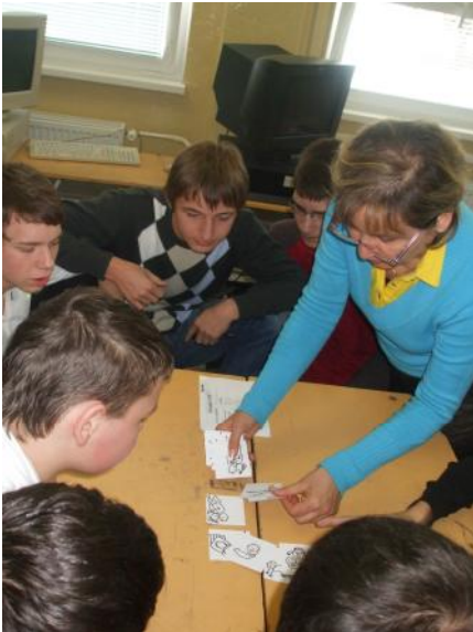
Zábery zo súťaže

Súčasne študentov informovali o prvých príznakoch infekcie HIV/AIDS, prevenciu pred nákazou vírusom HIV spôsobujúcim AIDS, postavení mladých ľudí v pandémii HIV/AIDS a trvalé úsilie zamerané na mladých ľudí, aby mali dostatok vedomostí a aby boli schopní sami sa chrániť pred touto chorobou.